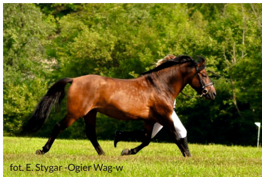
fot. E. Stygar -Ogier Wag-w

Zachowawcza Hodowla Konia Huculskiego w Wołosatem powstała w 1993 roku. Klacze zostały zakupione z prywatnej hodowli oraz państwowej stadniny koni w Siarach. Zasadniczym celem hodowli koni huculskich w Bieszczadzkiem Parku Narodowym jest utrzymanie wysokiej zmienności genetycznej, stabilizacja wzorca rasowego przy zachowaniu cech psychicznych i morfologicznych oraz doskonalenie cech związanych z użytkowaniem. W stadninie spośród 14 występujących w Polsce rodzin żeńskich utrzymywane są klacze reprezentujące cztery z nich są to: Agatki, Bajkałki, Wołgi i Wyderki. Do rozrodu dobierane są ogiery z hodowli państwowej lub hodowli prywatnych. Reproduktry, których używano w stadninie w Wołosatem reprezentują wszystkie linie męskie występujące w polskiej hodowli tj. Goral, Gurgula, Hroiego, Ousora, Pietrosu, Polana oraz Prisłopa.